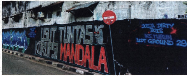
DITIMPA CAT - (atas) Penampakan mural yang telah ditimpa menggunakan cat berwarna hitam di salah satu bangunan yang ada di kawasan Perempatan Ketandan, Malioboro, Yogyakarta. (bawah) Penampakan mural "Usut Tuntas Korupsi Mandala Krida" sebelum ditimpa dengan cat hitam.