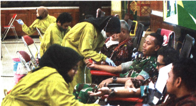
UNTUK SESAMA: Peserta mengikuti kegiatan donor darah dan pemeriksaan kesehatan secara gratis dalam rangkaian HUT ke-79 Pemkot Jogja di kompleks Balai Kota Jogja, kemarin (2/6).

Rangkaian HUT ke-79 Pemkot Jogja resmi dibuka, Selasa (2/6) dengan menggelar aksi donor darah dan cek kesehatan gratis (CKG) di Balai Kota Timoho. Kegiatan ini mendapat respons positif masyarakat, termasuk warga luar daerah.