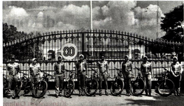
RAMAH LINGKUNGAN: Sejumlah petugas Satpol PP Kota Jogja saat melaksanakan patroli menggunakan sepeda pada Kamis (9/4).

menggunakan sepeda mampu untuk mengurangi penggunaan BBM. Lantaran sebelumnya patroli rutin wisata menggunakan kendaraan roda empat.