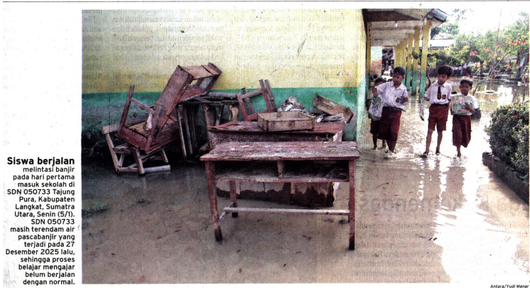
Siswa berjalan melintasi banjir pada hari pertama masuk sekolah di SDN 050733 Tajung Pura, Kabupaten Langkat, Sumatra Utara, Senin (5/1). SDN 050733 masih terendam air pascabanjir yang terjadi pada 27 Desember 2025 lalu, sehingga proses belajar mengajar belum berjalan dengan normal.

JOGJA-Dinas Pariwisata (Dinpar) DIY mencatat total kunjungan wisatawan selama 20 Desember 2025-4 Januari 2026 mencapai 2.270.228 orang.