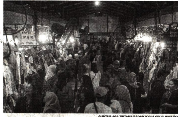
RAMAI PENGUNJUNG: Situasi Pasar Beringharjo, Kota Jogja, kemarin.

Kekhawatiran akan kondisi cuaca di Selat Bali juga didu-