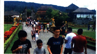
MUSIM LIBURAN: Wisatawan di DTW Ulun Danu Beratan, Tabanan, Bali, kemarin (24/12). Saat libur Nataru, turis domestik lebih dominan.

BANYUWANGI - Sebagai salah satu pintu masuk ke Bali, arus wisatawan menuju Pulau Dewata tentunya dapat dipantau dari Pelabuhan Ketapang, Banyuwangi, Jawa Timur. Baca Kapal... Hal 2