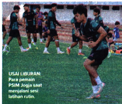
USAI LIBURAN: Para pemain PSIM Jogja saat menjalani sesi latihan rutin.

"Biasanya latihan pertama setelah libur sehari atau dalam hal ini seminggu seperti ini. Tidak terlalu banyak te-