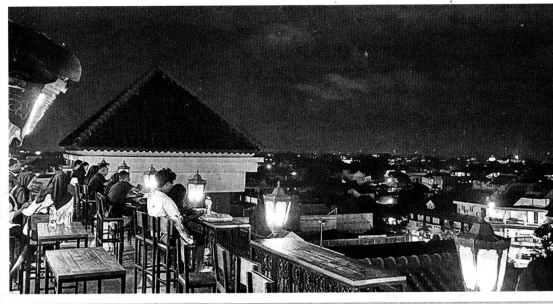
Muda-mudi menikmati suasana malam di rooftop Pasar Prawirotaman.

Dari pusat Kota Jogja, jarak ke tempat ini sekitar 2,3 kilometer atau 11 menit berkendara dengan mobil.