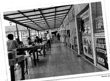
Area rooftop Pasar Sentul.