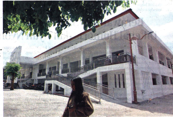
LEBIH MODERN: Inilah wajah baru Pasar Sentul di Kota Jogja yang terlihat lebih modern.