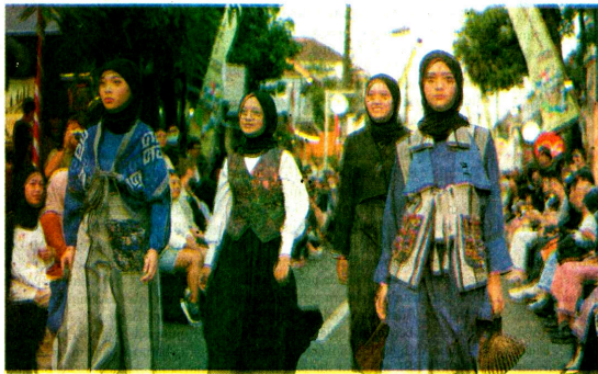
Para model memperagakan busana di jalanan, di hadapan penonton yang berjubel.