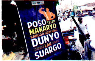
TETAP CARI REZEKI: Rontek bertuliskan dorongan semangat untuk tetap bekerja meski dalam keadaan berpuasa, di beberapa sudut Kota Jogja, kemarin (23/3).