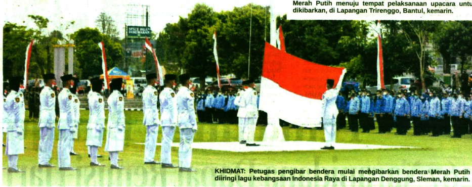
KHIDMAT: Petugas pengibar bendera mulai menghibarkan bendera Merah Putih diiringi lagu kebangsaan Indonesia Raya di Lapangan Deggung, Sleman, kemarin.