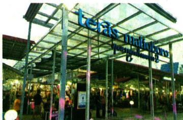
IKUT TERDAMPAK: Selain gedung DPRD DIJ, Teras Malioboro (TM) 2 juga akan dipindah karena dipakai untuk Jogja Planning Gallery (JPG).

Namun sebelum ke tahap penyusunan DED, pemrov terlebih dulu menentukan desain dasarnya. Langkah ini yang dilakukan dengan upaya melakukan sayem-