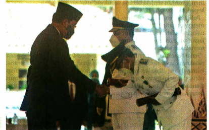
NAKHODA BARU: Gubernur Hamengku Buwono X melantik Penjabat Bupati Kulonprogo Tri Saktiyana di Bangsal Keparthan, kemarin (22/5). Foto kiri, gubernur saat jumpa pers sesuai melantik Penjabat Wali Kota Jogja Sumadi (kiri) dan Penjabat Bupati Kulonprogo.

Gubernur DIJ Hamengku Buwono X mengatakan, pengangkatan Pj pengangkatan Pj kepala daerah tersebut untuk mengantisipasi kevakuman kepemimpinan di Kota Jogja dan Kabupaten Kulonprogo. Sehingga, proses pengambilan keputusan penting tidak tertunda. Selain itu dapat terlaksana sesuai kewenangan yang ada pada penjabat wali kota dan bupati. Baca HB X... Hal C