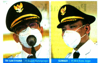
TRI SAKTIYANA Pj Bupati Kulonprogo