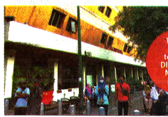
Tempat isolasi terpusat DIJ - Hotel Mutiara penuh.