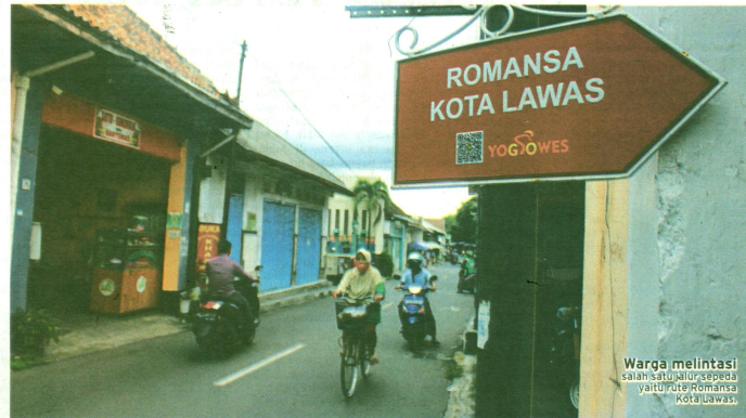
Warga melintasi salah satu jalur sepeda yaitu rute 'Romansa Kota Lawas'.

Kegiatan bersepeda bersemi menjadi tren begitu pandemi muncul. Adanya pembatasan kegiatan membuat masyarakat