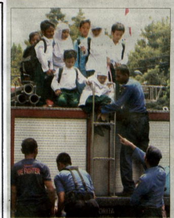
FOTO: FOTO: BHMU TALUQ/AGAR JOLIA ENJOY: Anak-anak dari SDIT Luqman Al Hakim saling membantu mengenakan pakaian petugas pemadam kebakaran yang kedodoran (kin). Mereka juga tampak menikmati ketika diajak berkeliling naik mobil PMK.