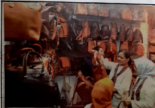
Ibu Negara Iriana Jokowi memilih tas di salah satu kios Pasar Beringharjo Yogyakarta.