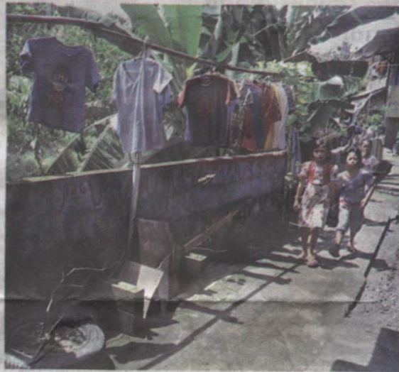
■ GANG SEMPIT

Kota Jogja diharapkan dapat menurunkan angka kemiskinan hingga 6,24 persen pada 2019 dan menjadi 5,45 persen pada 2022. Sedangkan sebaran warga miskin di Kota Jogja paling banyak di bantaran Kali Winongo. Yakni di Kelurahan Bumijo, Pakuncen, Wirogunan, dan Gedongkiwo. (sky/iwa/by)