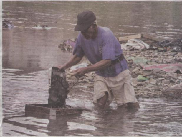
■ MENGAIS REZEKI