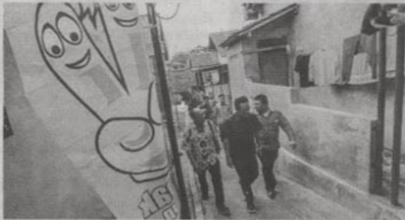
DUA CUKUP: Wakil Wali Kota Jogja Heroe Poerwadi (tengah) saat berjalan menuju Sudagaran yang kemarin diresmikan menjadi Kampung KB.

dibina dengan baik turut mengontrol besar kecilnya limbah rumah tangga. Itulah yang mempengaruhi lingkungan dari sampah hingga bau tak sedap di sungai. "Jangan jadi penonton. Tapi juga ikut terlibat dalam keberhasilan kampung KB," ucap mantan wartawan ini. (cr9/laz/zi)