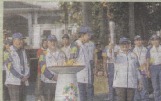
● Menteri Luar Negeri Retno Marsudi (ketiga kanan) memegang obor menjelang kirab obor Asian Games 2018 di Keraton Yogyakarta, DI Yogyakarta, Kamis (19/7).