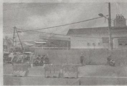
AKAN DITATA: Suasana di pintu selatan Stasiun Tugu Jogja. Para PKL yang dulu berjualan di lokasi tersebut merasa terabalkan karena tergusur. kalau target belum tahu persis, secepatnya lah," ujarnya. ketika ditemui di kantor DPRD Kota Jogja mengaku akan mengikuti semua proses yang berjalan. "Ya ikuti saja prosesnya," ujarnya. (pra/ila/er)