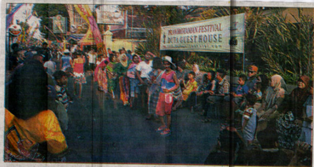
FASHION ON THE STREET – Jalan Prowirotaman semarak dengan peragaan busana, dan juga event-event menarik lainnya yang mengangkay potensi wisata kawasan Prowirotaman

Selanjutnya pada malam harinya terdapat 3 panggung utama yang tersebar di Prowirotaman I dan II. Panggung Utama di depan Hotel Perwita Sari menampilkan pantomim, beberapa group band Jogja, dan seni musik Hadrah. Panggung kedua di Hotel Pandanaran dengan penampilan 3 penari tradisional muda Jogja yang menghibur sebelum pagelaran ketoprak dari Kelompok Tri Mudo Budoyo. Sedangkan Panggung Ketiga di Hotel Gallery Prowirotaman 2 diselenggarakan Pagelaran Wayang Kulit. (vin)