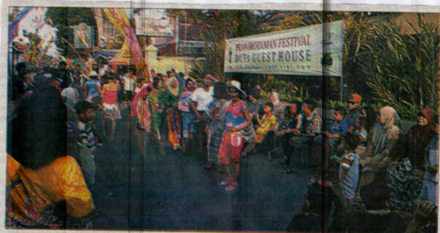
FASHION ON THE STREET – Jalan Prawirotaman semarak dengan peragaan busana, dan juga event-event menarik lainnya yang mengangkay potensi wisata kawasan Prawirotaman

Selanjutnya pada malam harinya terdapat 3 panggung utama yang tersebar di Prawirotaman I dan II. Panggung Utama di depan Hotel Perwita Sari menampilkan pantomim, beberapa group band Jogja, dan seni musik Hadrah. Panggung kedua di Hotel Pandanaran dengan penampilan 3 penari tradisional muda Jogja yang menghibur sebelum pagelaran ketoprak dari Kelompok Tri Mudo Budoyo. Sedangkan Panggung Ketiga di Hotel Gallery Prawirotaman 2 diselenggarakan Pagelaran Wayang Kulit. (vin)