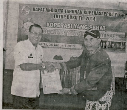
RAPAT KOPERASI -- Walikota Jogja Haryadi Suyuti bersama Ketua Koperasi PPKL-Y, Rabu (28/1), di sela-sela acara rapat anggota tahunan koperasi tersebut.

Target semula Rencana Pendapatan Hasil Usaha Akhir Tahun 2014 sebesar Rp 62,5 juta tercapai target Rp 63,9 juta. "Hal ini sangat menggembirakan bagi anggota PPKL-Ym" kata Wawan. (fir)