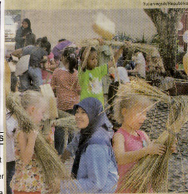
Mengisi Liburan Sejumlah anak membawa orang-orangan sawah dari bahan bambu saat mengikuti kegiatan "Karnaval Budaya bersama Perpustakaan Kota Yogyakarta", belum lama ini. Kegiatan ini digelar untuk mengisi liburan sekolah.