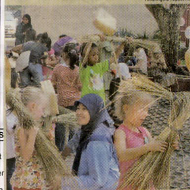
Mengisi Liburan Sejumlah anak membawa orang-orangan sawah dari bahan bambu saat mengikuti kegiatan "Karnaval Budaya bersama Perpustakaan Kota Yogyakarta", belum lama ini. Kegiatan ini digelar untuk mengisi liburan sekolah.