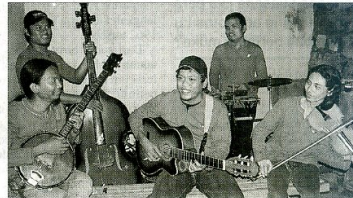
GAYENG: Kedatangan Wawali dan Ketua Dewan Kota disambut hiburan musik warga setempat.