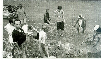
NYEMPLUNG KALI: Sampah dan material yang mengganggu aliran Code dibersihkan oleh warga, biar aliran lancar.