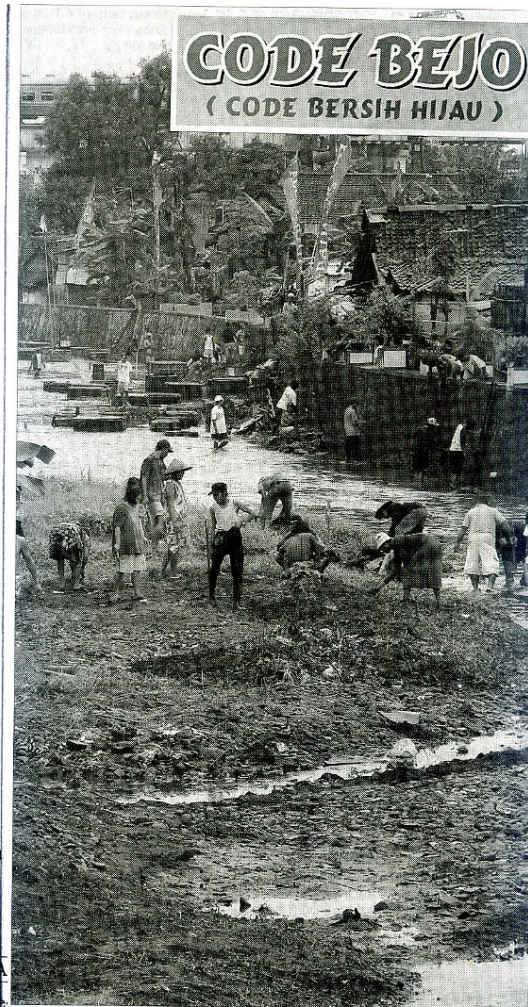
SEPUR LIWAT: Sebuah kereta api melintas di jembatan Kliringan (belakang) sementara warga tetap antusias bekerja bakti.