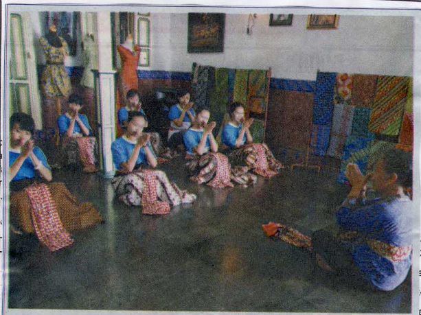
Peserta berlatih tari untuk menuju cita-cita Kadipaten sebagai kampung wisata.