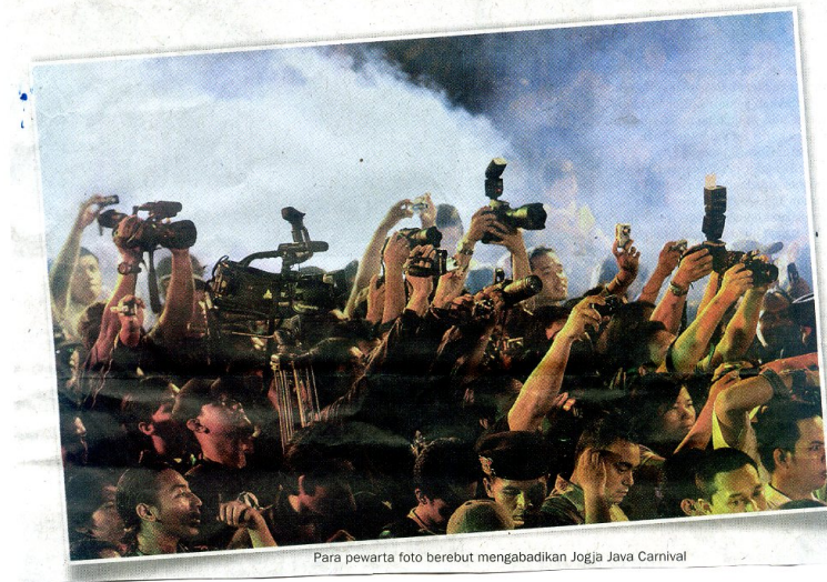
Para wartawan foto berebut mengabadikan Jogja Java Carnival